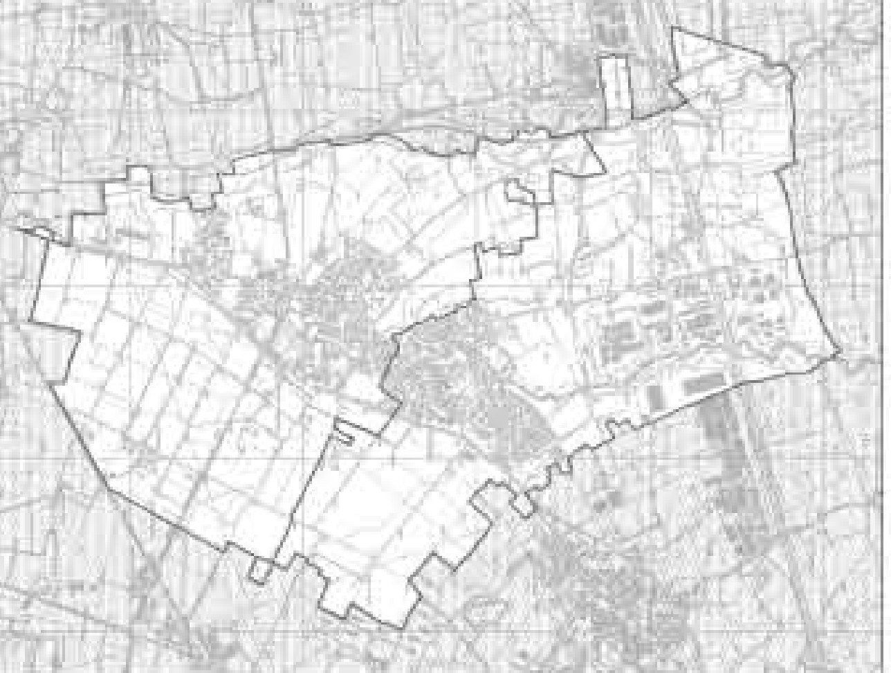
DOCUMENTO DI PIANO - Elaborati concettivi Dp 03.3.2 - Stato di fatto delle reti idrologiche, gasdotto e rete elettrica