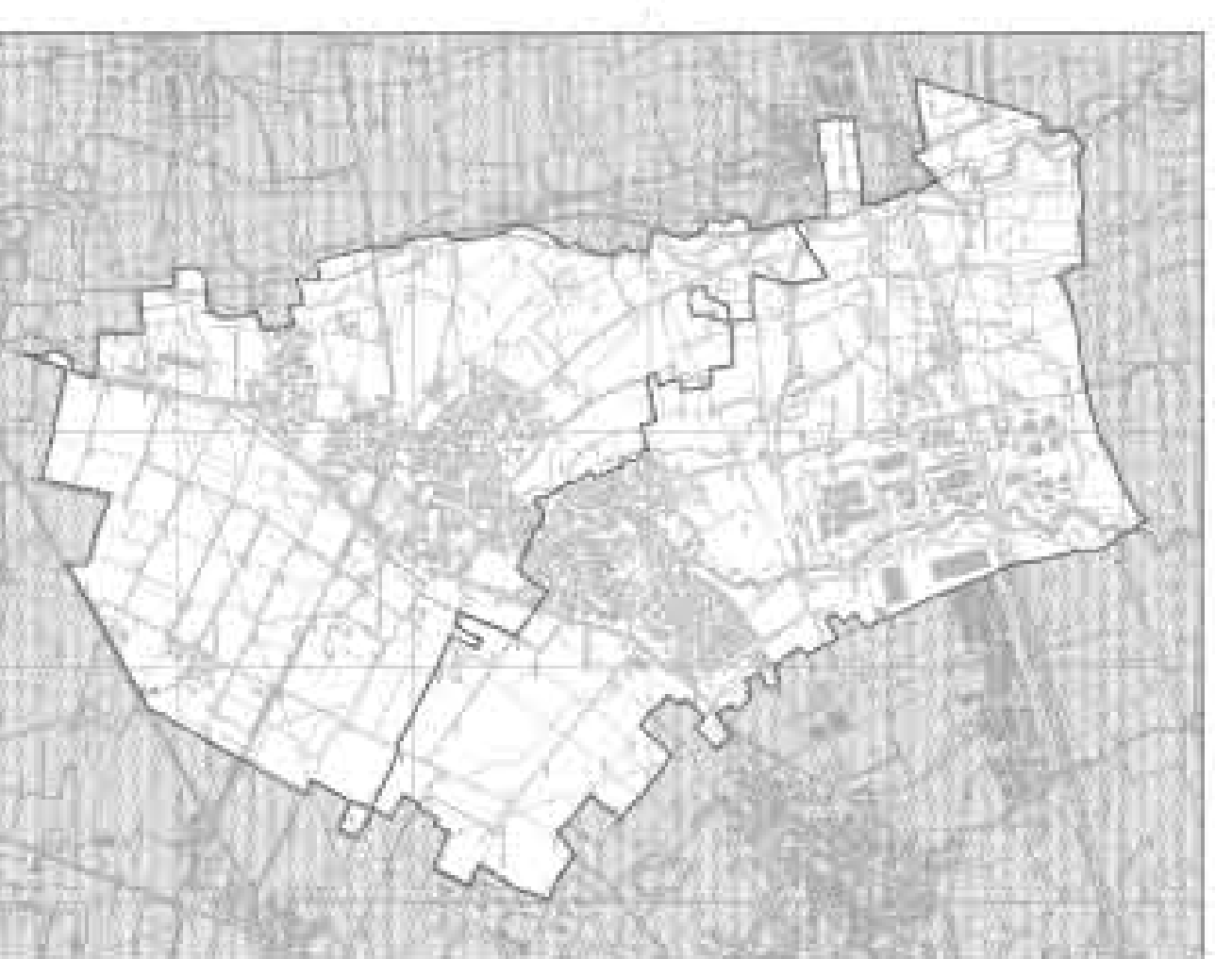
DOCUMENTO DI PIANO - Elaborati concettivi Dp. 03.3.1 - Stato di fatto delle reti idrologiche, Acquedotto e Fognatura comunale