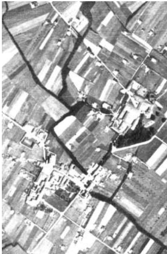
Basiano, volo GAI 1954