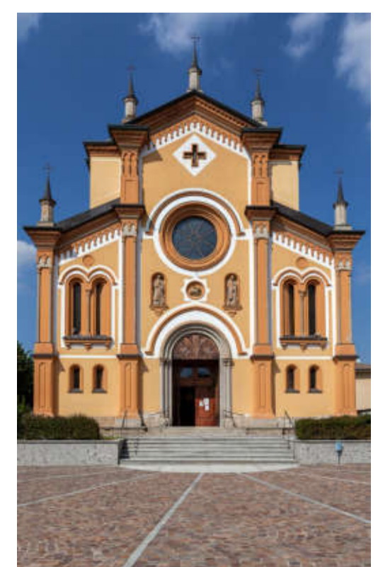
Chiesa di San Gregorio Magno

PGT adeguato alla L.r. n.31/2014 e s.m.i.